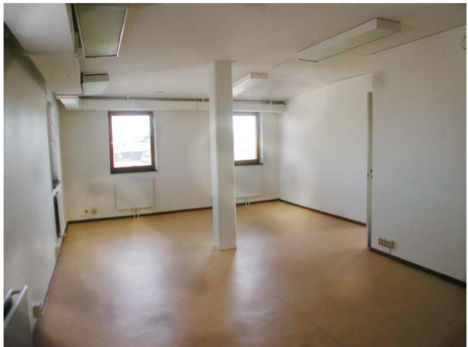
Bild 2. Interiör kontor