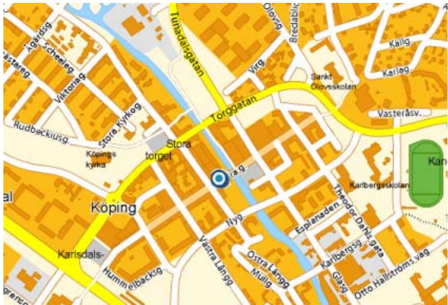
Bild 1. Utdrag ur stadskartan över centrala Köping