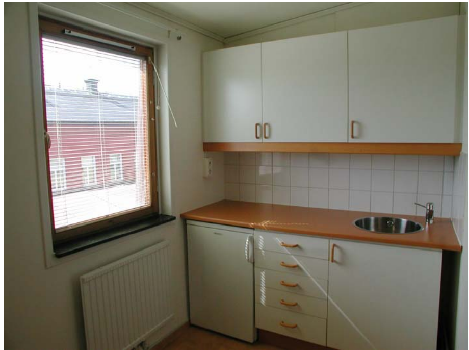
Bild 3. Pentrydel kontor